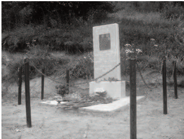
Հուշաքար՝ կանգնեցված Վարդանի և իր ընկերների գոհվելու վայրում

Ես ցավով եմ ասում՝ մեզանից անընդհատ խլել են, դարեր հետո մենք կարողացանք հաղթանակ արձանագրել ու ... ժողովրդի սոցիալական ծայրահեղ պայմանները ստիպեցին, որ ինքը չսիրի իր հաղթանակը, երևի տարիներ պիտի անցնեն, որ արժևորվի արցախյան ազատամարտը: Շատ հակասական երևույթներ տեղի ունեցան: Այսինքն՝ նա, ով արժանի է, չի ապրում այնպես, ինչպես հարկն է. պատերազմի դաշտում գոհված նվիրյալի կինն ու երեխաները չեն ապրում լավ պայմաններում: Ի վերջո, ամենաթանկ բանը կյանքն է, և տարիներ առաջ մարդիկ զոհաբերեցին այն, ուստի գոնե նրանց հարազատների նկատմամբ պետք է յուրահատուկ վերաբերմունք ունենալ. դրանով հաջորդ սերունդներն են դաստիարակվում: Նյութականը չէ, որ այդքան կարևոր է, ուշադ-