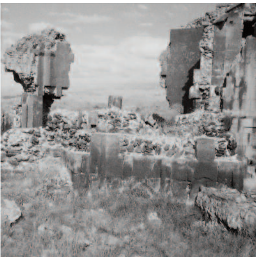
Անիի Սբ. Գրիգոր Լուսավորիչ եկեղեցի

արևելյան գաղափարախոսության շրջանակներում, այլև աշխարհի առաջադեմ երկրների հետ համաքայլ առաջընթանալիս: Հանդիպման երկրորդ մասը նվիրված էր 2007թ. Անկարայում «ԻԿԱՆԱՍ-38» արևելագիտական միջազգային համաժողովին, որը 150 տարվա պատմություն ունի, զբաղվում է հյուսիսաֆրիկյան երկրներից մինչև Հեռավոր Արևելքի երկրներով և իր հիմնադրմամբ պարտական է ֆրանսիացի գիտնականներին: «ԻԿԱՆԱՍ»-ին հյուրընկալելը պարտադիր է իր գիտության զարգացմամբ շահագրգռված յուրաքանչյուր երկրի համար: Թուրքիայում այն երկրորդ անգամ էր անցկացվում: Մասնակցում էին մոտ հազար գիտնականներ աշխարհի ամե-