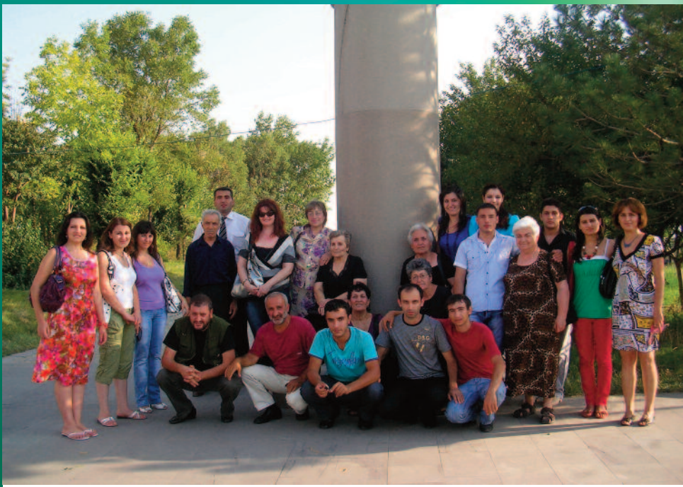
Գիտելիքի օրը վարդանանքցիները իրենց համախոհների հետ մշում են եռաբլուրում

«Վարդանանք» երկամսթերթ Հիմնադիր հրատարակիչ ԵՊՀ «Վարդանանք» ՌՀԴԱ Գլխավոր խմբագիր՝ Արփի Խաչատրյան Դիգայնը և համ. ձևավորումը՝ Արշակ Ծառուկյանի Սրբագրիչ՝ Նար Վարդանյան http://vardananq.do.am Էլ.փոստ՝ vardananq@gmail.com Տպաքանակը՝ 99 Ծավալը 1.5 տպ.մամուլ: Տպագրության եղանակը օֆսեթ: ԵՊՀ տպագրատուն, Աբովյան փող. 52: